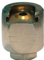
Art. 5995 Testina "ES. 22" cingoli M10x1