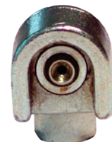
Art. 5985 Testina a gancio TE 15 mm M10x1