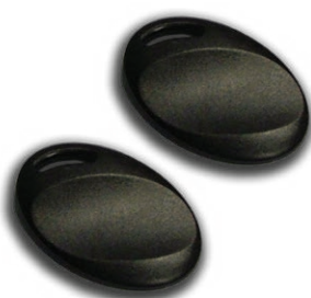
Art. 4658 Bottone automezzo