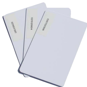
Art. 4656 Badge utente

Gestione computerizzata dei prelievi di gasolio.