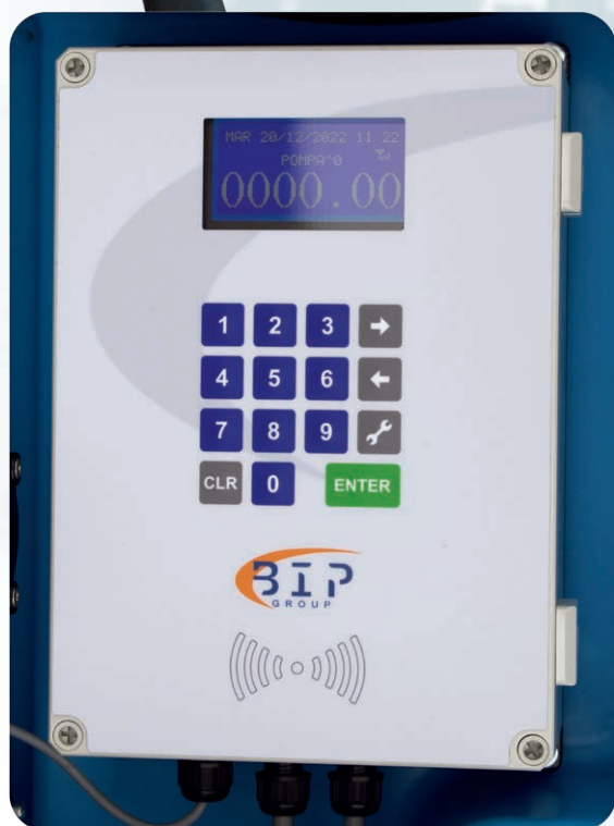
Art. 4651 Terminale Ambrogio