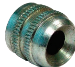
Artikelnr. 5996 aufgeweitetes Mundstück M10x1