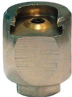
Artikelnr. 5995 Mundstück "ES. 22" Ketten M10x1