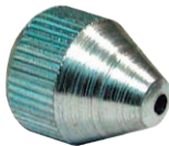
Artikelnr. 5998 kegelförmiges Mundstück M10x1