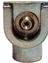
Artikelnr. 5990 Stoßkopf TE 15 mm - M10x1