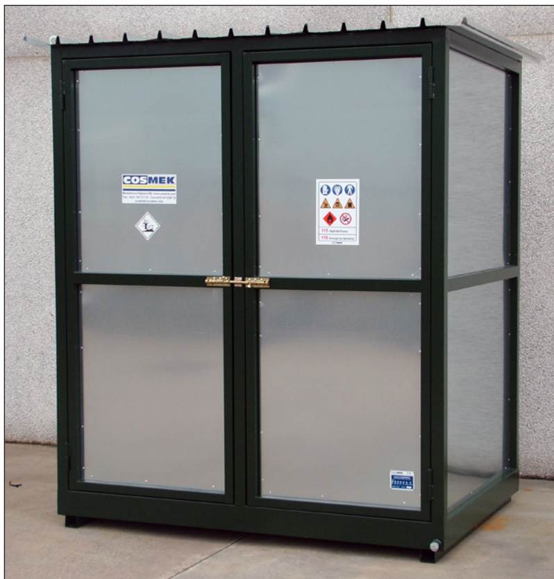
Art. FITO BOX 2

La soluzione ideale per lo stoccaggio dei prodotti fitosanitari e di altri prodotti pericolosi, in conformità alle norme in materia di tutela della salute umana, della sicurezza nei luoghi di lavoro e per l'ambiente.