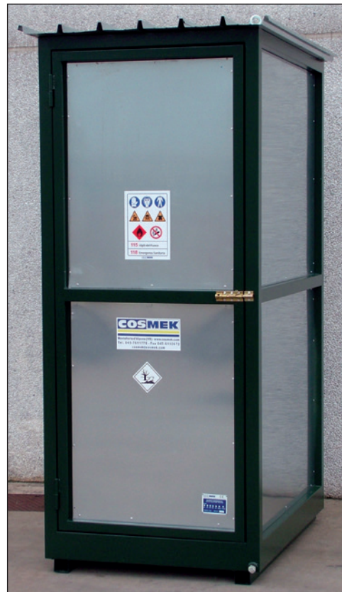
Art. FITO BOX 1

Largh. 2000 x Prof. 1400 x Altezza 2400 mm