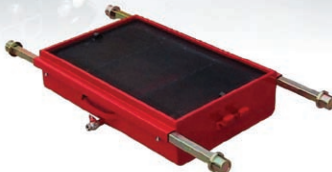
Artikelnr. 7541 Fahrbare Grubenwanne Fas- sungsvermögen 70 Liter