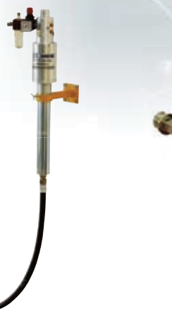
Artikelnr. 7520 Bausatz Grubenwanne bis zu 30 Liter