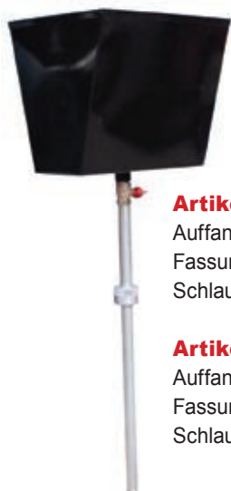
Artikelnr. 7570 Auffangschale Fassungsvermögen 10 Liter mit Schlauch und Ring 2"