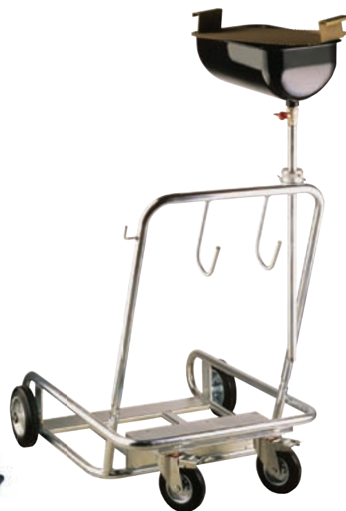
Artikelnr. 7504 Karre für Fässer 50 kg mit Sammelschale 10 Liter.