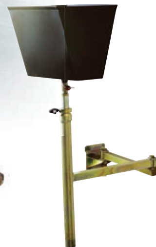
Artikelnr. 7574 Wanne bis zu 25 Liter mit Schwenkarm