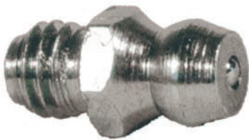
Fettpresse HYDRAULIK gerade mit Kugelkopf. Gemäß Norm UNI 7.663 A