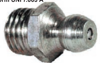
Fettpresse HYDRAULIK gerade mit Kugelkopf. Gemäß Norm UNI 7.663 A

ABMESSUNGEN A= konisches Gewinde ch= Inbusschlüssel L= Gesamtlänge L1= Gewindelänge