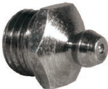
Fettpresse HYDRAULIK gerade mit Kugelkopf. Gemäß Norm UNI 7.663 A