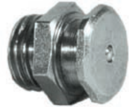
Fettpresse mit doppeltem Sechskantkopf Tecalemit. Gemäß Norm UNI 7662 B

Fettpresse aus Stahl AISI 303 AVP 11 SmPb37 - UNI EN 10204 Weißverzinkt (7 Mikron). Geeignet für jeden Fetttyp.