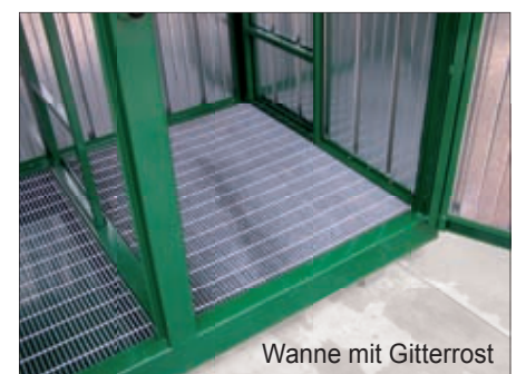
Wanne mit Gitterrost