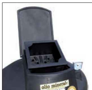
Lukenöffnung für Filterabtropfschale