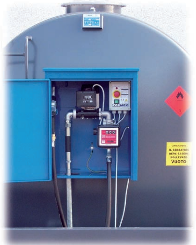
Mechanischer Literzähler K33

SAMMELWANNE aus Kohlenstoffstahlblech mit selbsttragenden Rahmen, bereits an den Füßen des Behälters vorverbolzt, geeignet für die Positionierung auf allen Arten von Böden, realisiert gemäß der vom D.M. 19/03/90 vorgesehenen Sicherheitsvorschriften, ausgestattet mit Auslass 1" mit Sicherheitsverschluss und VOLLSTÄNDIG MIT EPOXIDPULVER LACKIERT.