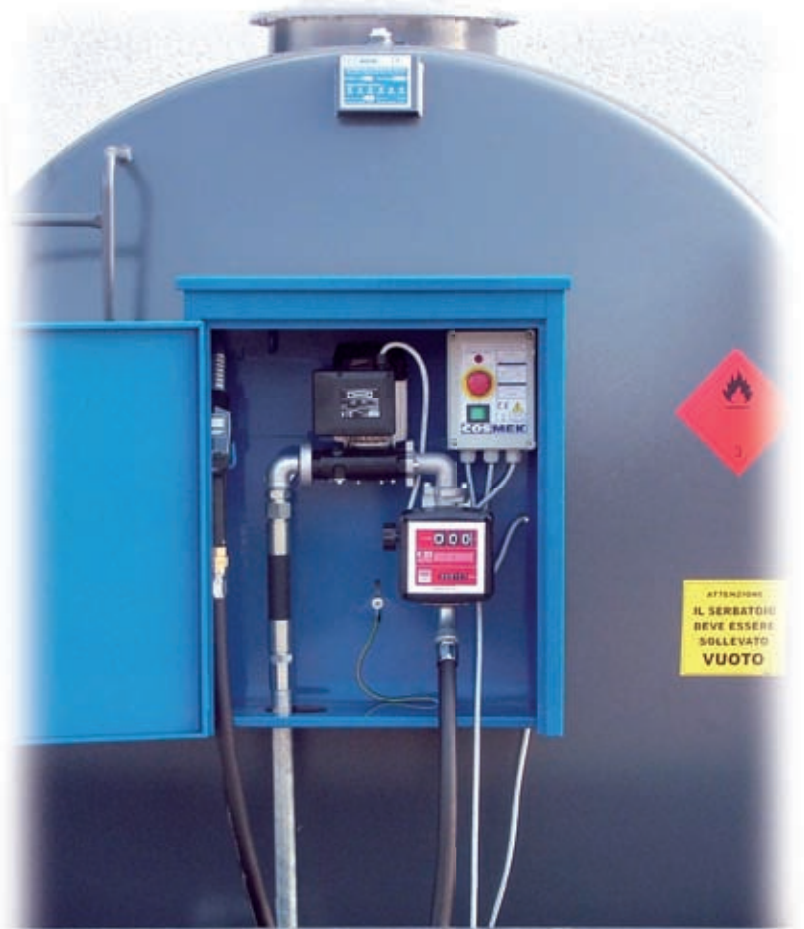
Mechanischer Literzähler K33

SAMMELWANNE aus Kohlenstoffstahlblech mit selbsttragenden Rahmen, bereits am Behälter vorverbolzt, geeignet für die Positionierung auf allen Arten von Böden, mit Fassungsvermögen nicht unter 100 % der gesamten geometrischen Kapazität ausgestattet mit Auslass 1" mit Sicherheitsverschluss, 4 Halterungen für die Dachträger und VOLLSTÄNDIG MIT EPOXIDPULVER LACKIERT.